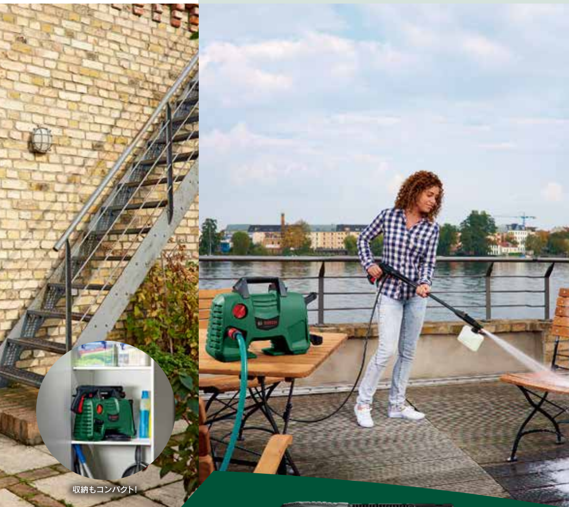
收納もコンパクト!